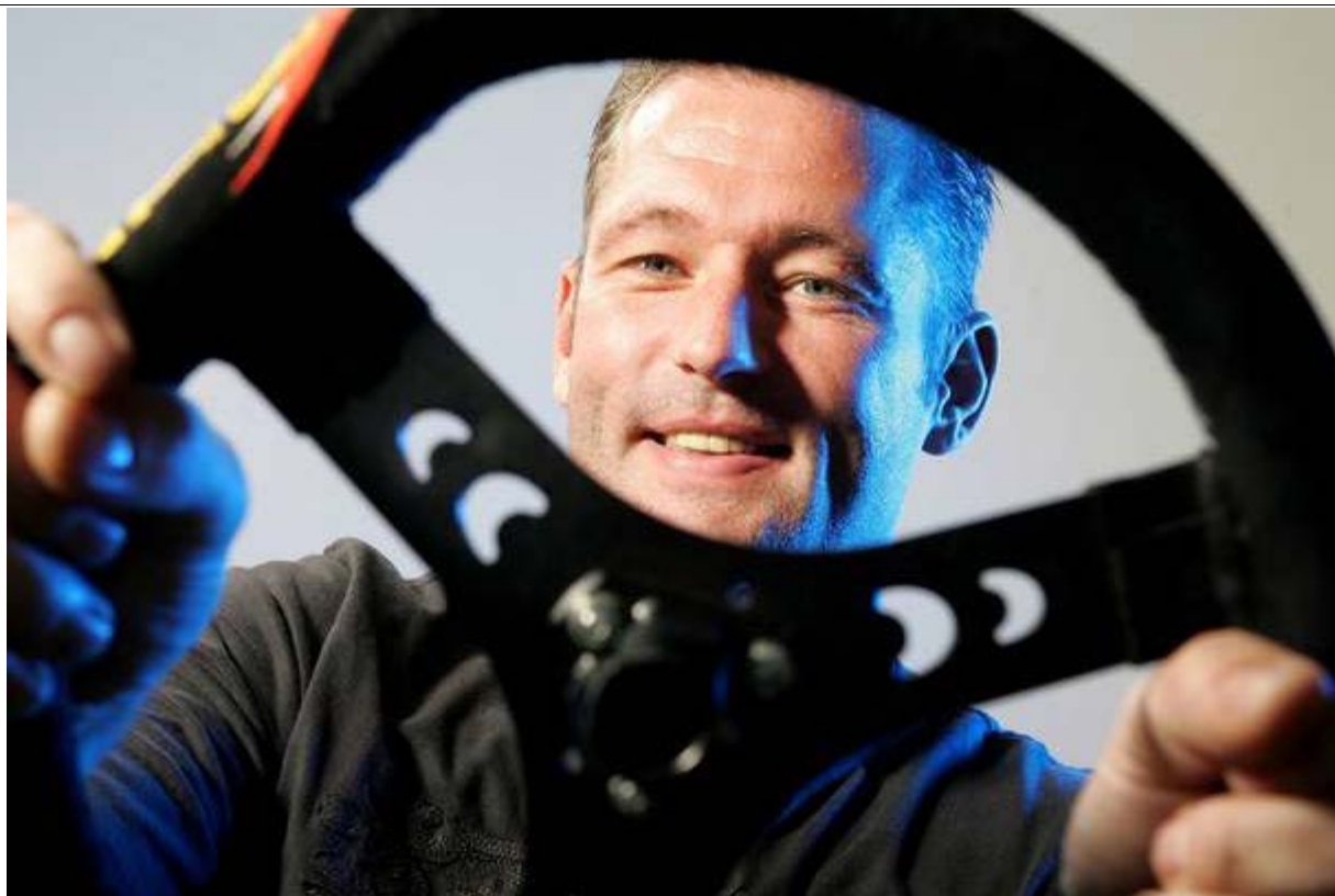
Vader Jos Verstappen, Formule 1-coureur tussen 1994 en 2003.

Jos Verstappen, vader van Max en Formule 1-coureur tussen 1994 en 2003, is de constante factor in die omgeving van Verstappen junior. De Nederlandse oud-Formule 1-coureur Robert Doornbos denkt dat vader Jos zijn zoon optimaal voorbereidt op de Formule 1 en dat Max daarom een voorsprong heeft op andere jonge coureurs. 'Max is racegeoriënteerd opgevoed, wordt behoed voor valkuilen en zijn vader is er straks elk weekeinde bij', zegt Doornbos.