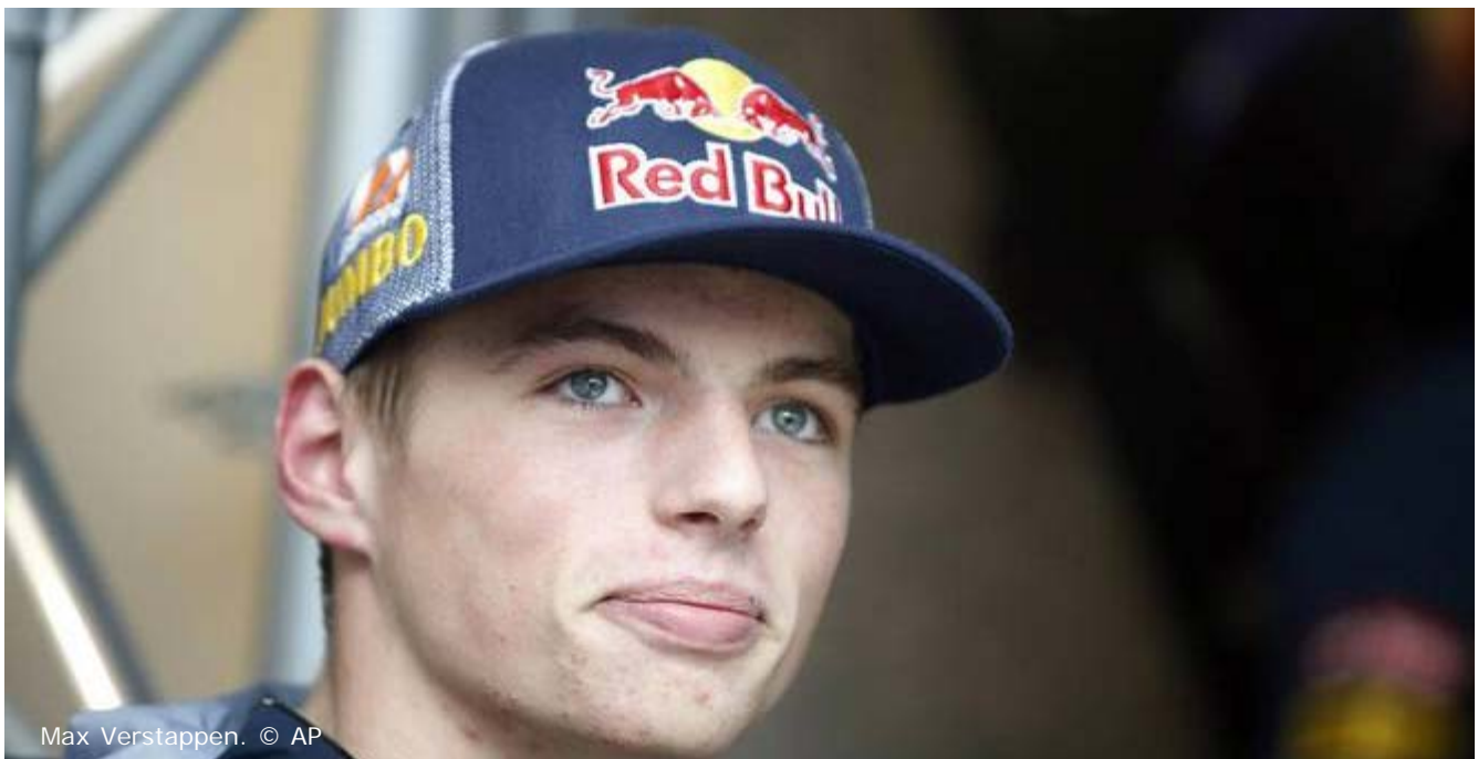
Max Verstappen.