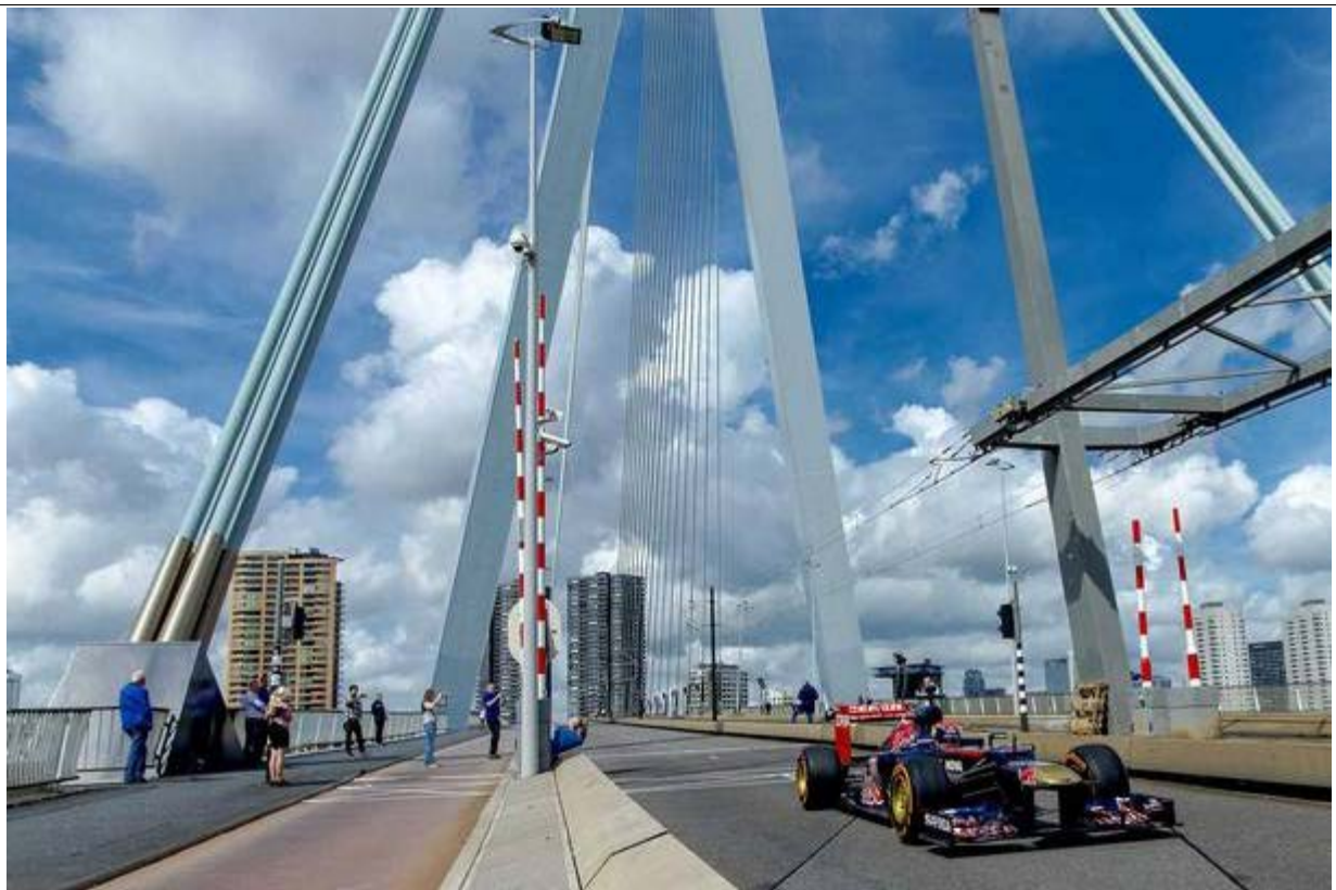
Max Verstappen rijdt in de F1 Scuderia Toro Rosso over de Erasmusbrug, daags voor het VKV City Racing evenement in Rotterdam.