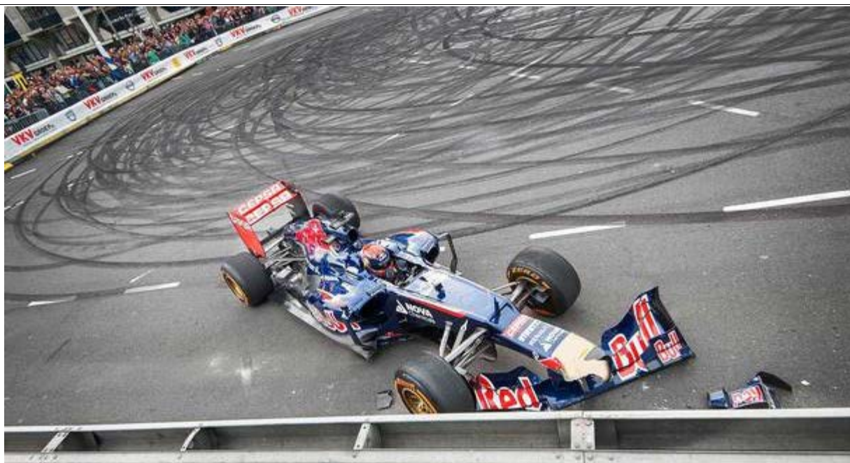
Max Verstappen belandt in de vangrail tijdens de VKV City Racing.

Een 17-jarige is volgens hem impulsiever dan een 25-jarige. Jolles: 'Die impulsiviteit kan voordelen hebben in termen van een iets riskantere strategie hanteren die tot winst leidt, maar zo'n strategie kan ook leiden tot ongelukken.' Om risico's goed te kunnen afwegen, is ervaring nodig. Of Verstappen wel of niet die ervaring heeft, kan Jolles niet beoordelen. "Sommige 17-jarigen hebben wel een grotendeels gerijpt brein omdat hun omgeving ze in staat heeft gesteld waardevolle ervaringen en kennis op te doen en daarmee hun talenten te ontwikkelen.'