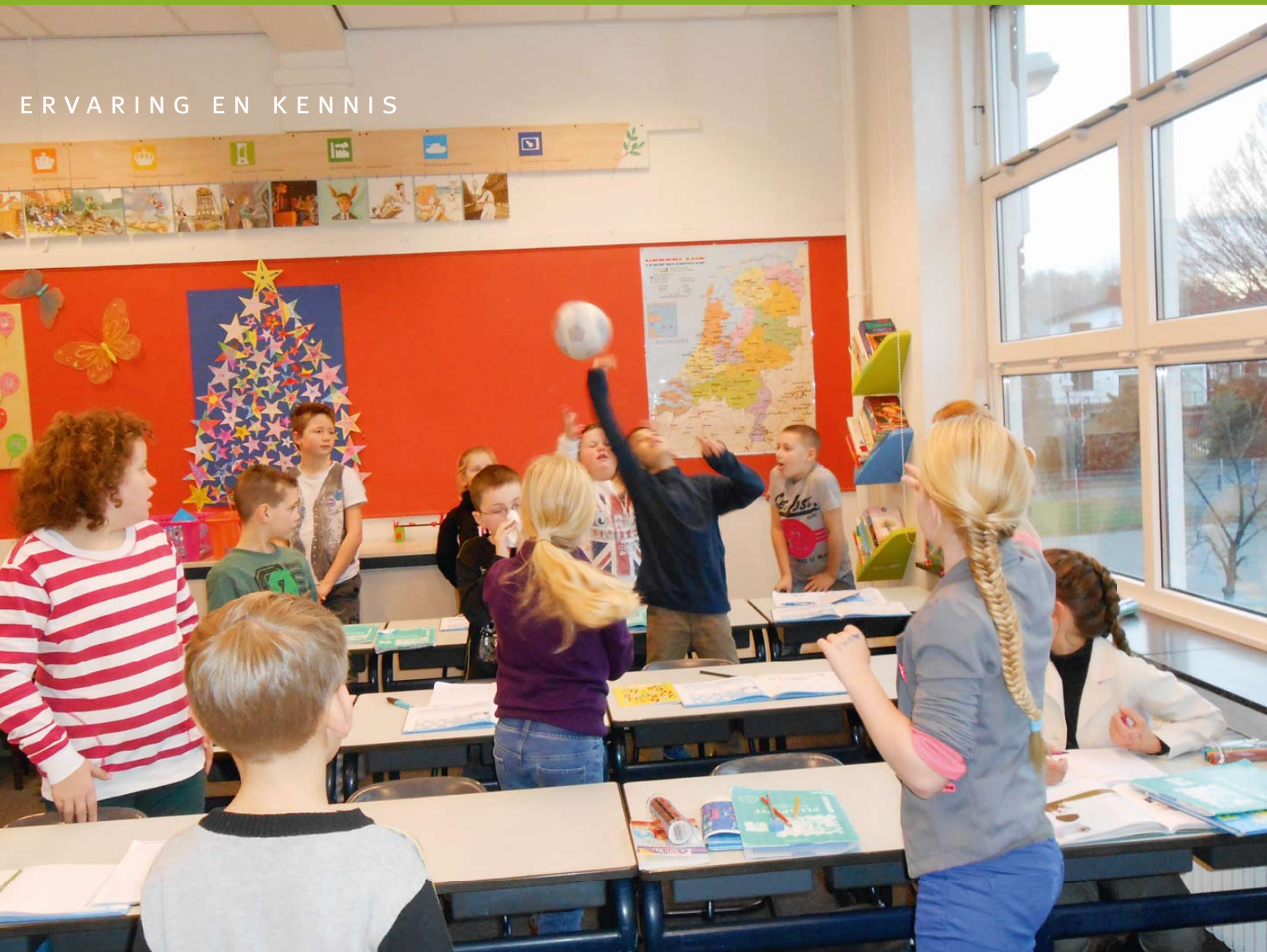
Basisschool Gerardus Majella is 'proeftuin' voor (brein)onderzoek en neemt deel aan studiedagen: "Hoe meer we weten over het leren van kinderen, hoe beter."